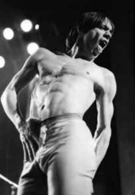
Iggy Pop, Ann Arbor Michigan 1979