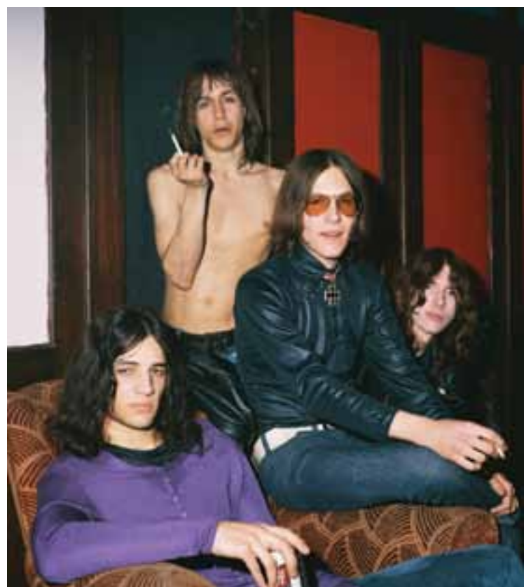
Iggy, Scott, Ron e Dave Alexander

Quella tra Jarmusch e Iggy Pop è un'amicizia lunga venticinque anni e Gimme Danger è la terza occasione che li vede insieme per via di un film: prima l'indimenticabile parte di Iggy in Dead Man accanto a Johnny Depp (1995), poi i botta e risposta dell'assurdo con Tom Waits in Coffee and Cigarettes (2003). Jim e Jim sono entrambi uomini del Midwest e, nonostante la differenza d'età, c'è un linguaggio e soprattutto un retaggio comune. Da una parte Jarmusch che racconta di essere cresciuto con band come Stooges, MC5 e Velvet Underground, perché "Il loro suono working class parlava da vicino a me e ai miei amici, non come la musica californiana hippie" . Dall'altra l'Iguana, che nel corso del docu-film mette più volte in prospettiva socio-culturale e (anti)politica gli Stooges, sottolineando come "In quegli anni il rock'n'roll era monopolizzato da una congiuntura politico-economica di cantanti corrotti, manager e discografici malvagi che volevano creare quello che ritenevano il miglior prodotto per loro" e, mentre fa il verso a Crosby, Stills & Nash, racconta di un tradimento culturale, in cui "Le più grandi manifestazioni 'peace and love' nei cinque anni d'amore della California furono organizzate a tavolino. E infatti certe cose... Puzzano, ancora puzzano" . Un'amicizia e una visione comune che circa dieci anni fa indussero James Osterberg ad affidare nelle mani di Jim Jarmusch il primo documentario