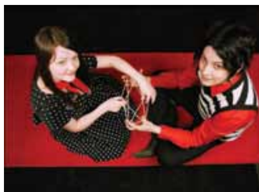
The White Stripes

sobborgo bianco di Detroit) col suo ibrido rap-metal, nonché ovviamente del fenomeno White Stripes, capofila assieme ai meno noti concittadini Dirtbombs e Von Bondies di una sorta di revival garage che, nel caso degli Stripes, mantiene una spiccata filiazione blues, chiudendo cerchi aperti - come abbiamo visto - molto, moltissimo tempo prima. I duemila però sono indubbiamente gli anni di Eminem, il più grande rapper bianco di sempre. Nativo di ST. Joseph nel Missouri ma stabilitosi nella Motor City fin da ragazzino, con The Marshall Mathers LP del 2000 offre la sua turbolenta visione delle cose all'intero pianeta, come poi farà per tutti gli anni Zero, calandosi con discreti risultati anche nel ruolo di attore. È l'ultimo figlio importante in ordine di tempo di una città che ha sempre saputo fornire risposte vitali e avventurose a questioni complesse, spesso distruttive. Che sa gettare il cuore oltre l'ostacolo mediatico rovesciando il paradigma del "ruin porn", come splendidamente suggerisce l'angelica desolazione filmata da Jim Jarmusch in Solo gli amanti sopravvivono , dove due particolari vampiri attraversano la decadenza terminale delle sue case, strade e teatri come se fosse una forma astratta di nutrimento. Detroit corre il rischio di diventare la più sterminata delle ghost town, ma nel frattempo sopravvive al proprio estinguersi, coltivando la formidabile speranza delle contraddizioni. ◀