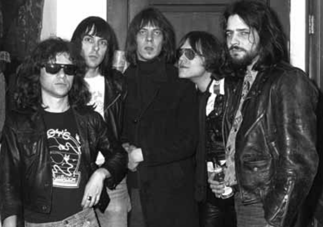
Tommy & Johnny Ramone, Fred Smith, Ron & Scott Asheton, Ann Arbor 1977