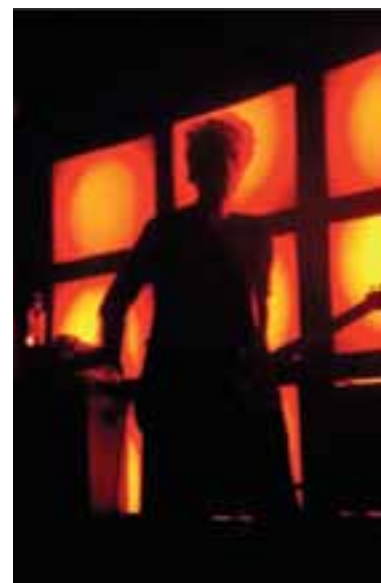
Jim Jarmusch, Berlino 2013