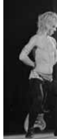
Iggy Pop, Detroit 1973

contatto fra major e underground alternativo tra Sessanta e Settanta, una sorta di talent scout col debole per gli acidi), colui che scriverò nello stesso giorno - il 22 settembre 1968 - MC5 e The Stooges. Ma anche un testimone importante in Gimme Danger , che racconta di "aver sentito", ancora prima che aver visto, la potenza live di Iggy e soci mentre raggiungeva l'aula dell'Università del Michigan dove si esibivano quella domenica pomeriggio - "Non posso minimizzare ciò che vidi su quel palco. Non avevo mai visto tanta energia atomica provenire da una sola persona" , racconta in Please Kill Me , "la Bibbia del punk" in forma di storia orale. A essere profondamente impressionato fu anche Alan Vega (e un'altra manciata di maestri dei maestri, da Patti Smith a Miles Davis), durante il primo concerto degli Stooges a New York nel settembre del '69: "Non era teatrale, era arte drammatica. Iggy non stava recitando, era tutto vero. A fine live vidi il pubblico lanciare bottiglie e rose al suo cospetto. Quel giorno la mia vita è cambiata" . E come un rito senza tempo, ancora tredici anni fa in occasione del tour di "riunificazione" iniziato nel 2003, Iggy Pop, Ron e Scott Asheton, un inarrestabile Mike Watt al basso e Steve MacKay al sax, ribaltavano i connotati - e il concetto di performance - di cinquantamila persone al Traffic Festival di Torino, in quello che per molti di noi presenti resta uno dei live più importanti della vita.