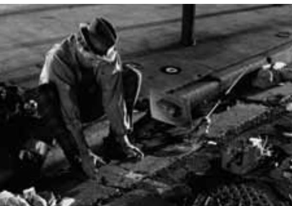
Tom Waits in Down By Law

ta”, un’unica vibrazione che “avvolge” il film più che accompagnarlo. In altri casi ancora irradia la sua influenza da sottopelle. Dal mondo dei Wu-Tang Clan, Ghost Dog non prende a prestito soltanto l’ipnotica colonna sonora di RZA, ma influenze, riferimenti incrociate, e un principio compositivo dell’hip-hop che porta il suo autore a re-mixare le trame del noir di Melville con i precetti della guida spirituale per guerrieri dell’Hagakure, sottocultura urbana e filosofia orientale. Un’altra volta, non si tratta di una sfida infantile a scovare indizi e citazioni, ma dell’arte che appartiene al buon musicista: trovare la giusta risonanza. ✕